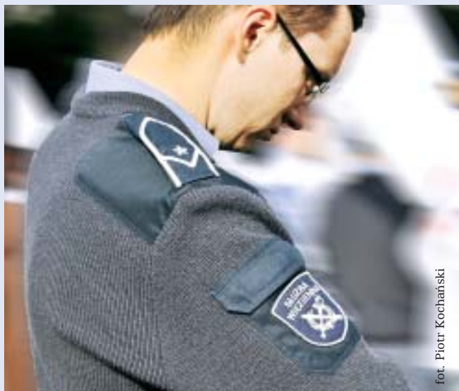
fol. Piotr Kochański