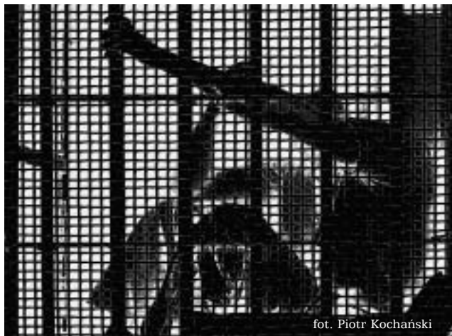
14-19 Prezentacje - OISW Łódź