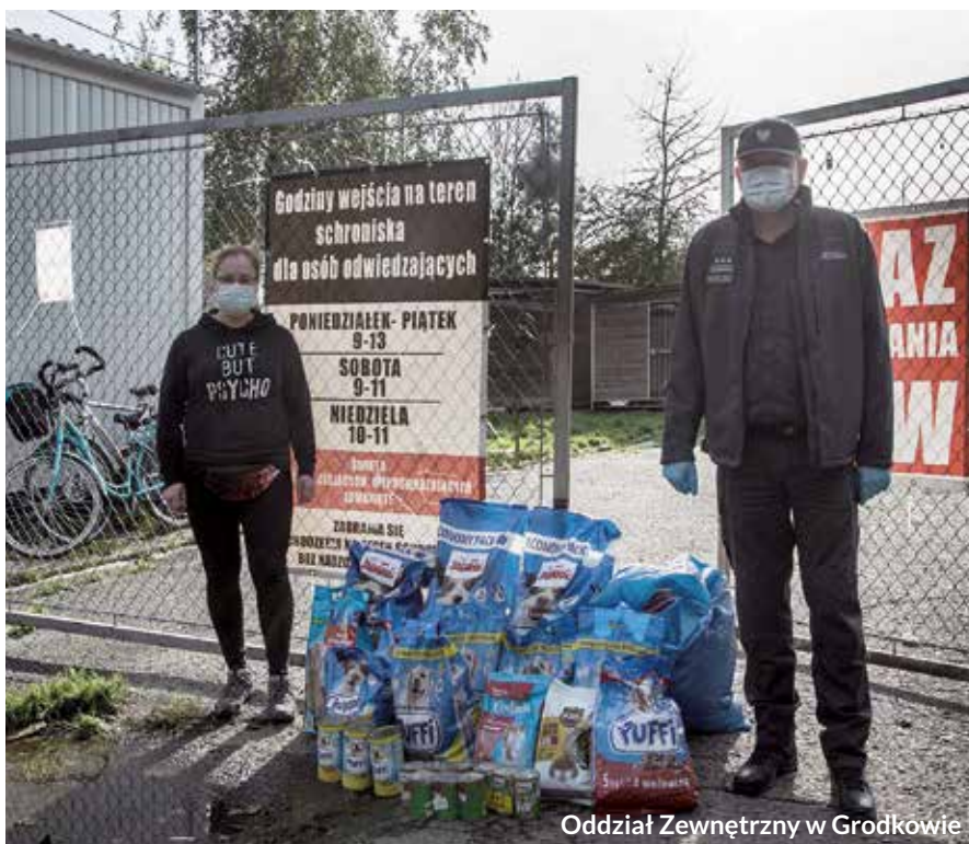
Oddział Zewnętrzny w Grodkowie