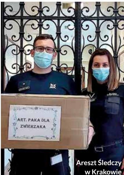
Areszt Śledczy w Krakowie