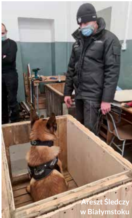
Areszt Śledczy w Białymstoku