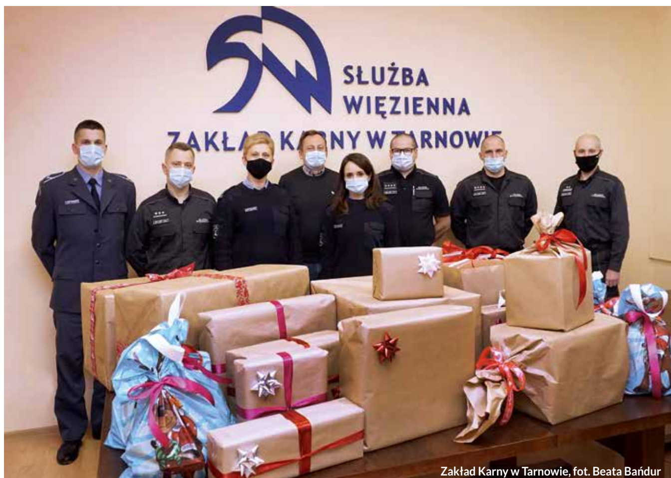
Zakład Karny w Tarnowie