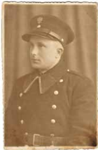
Niższy funkcjonariusz SW w stopniu strażnika w umundurowaniu zimowym (umundurowanie wz.1932). Zdjęcie pozowane: Baranowicze 1938.04.12