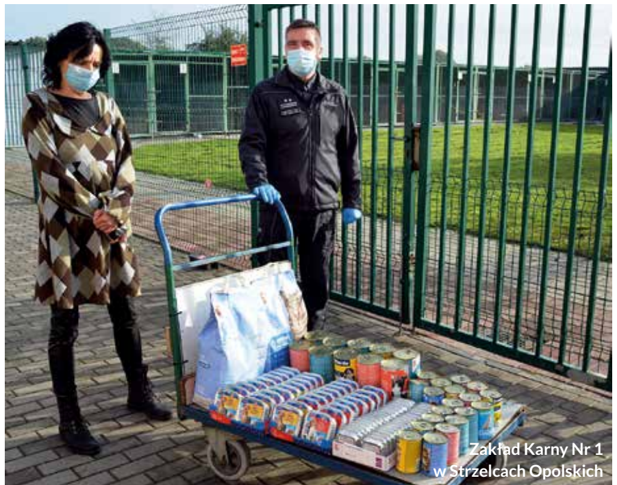
Zakład Karny Nr 1 w Strzelcach Opolskich