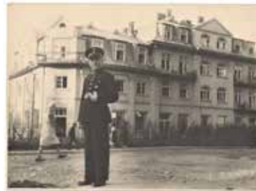
Niższy funkcjonariusz SW w stopniu starszego strażnika (umundurowanie wz.1932). Połowa lat 30. XX w. Okoliczności nieznane.