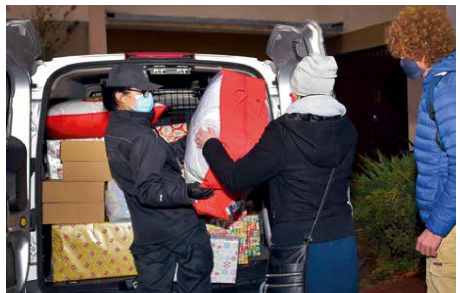
Areszt Śledczy w Warszawie-Służewcu