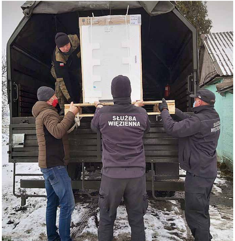
Zakład Karny w Hrubieszowie

Zbiórka w CZSW ruszyła z początkiem grudnia i trwała pięć dni. Każdego dnia zebrana suma rosła. W pierwszym dniu funkcjonariusze i pracownicy wrzucili do pudełka ponad 600 zł, drugiego 1800 zł, a trzeciego prawie dwa tysiące złotych. W ostatnim dniu zbiórki było już ponad siedem tysięcy złotych. Oprócz tego codziennie ktoś coś przynosił. Ludzie umawiali się, którą rzecz z listy kupić. Wśród ufundowanych prezentów znalazły się buty, kurtki, żywność, środki czystości,