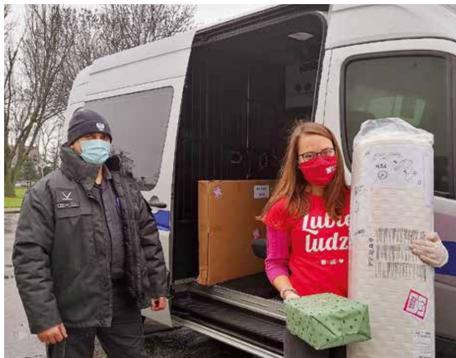
Zakład Karny w Zamościu

– To był prawdziwy weekend cudów – mówią funkcjonariusze zaangażowani w akcję Szlachetnej Paczki.