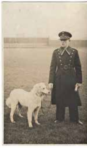
Niższy funkcjonariusz SW w stopniu starszego strażnika z psem w umundurowaniu zimowym (umundurowanie wz.1932). Połowa lat 30. XX w.