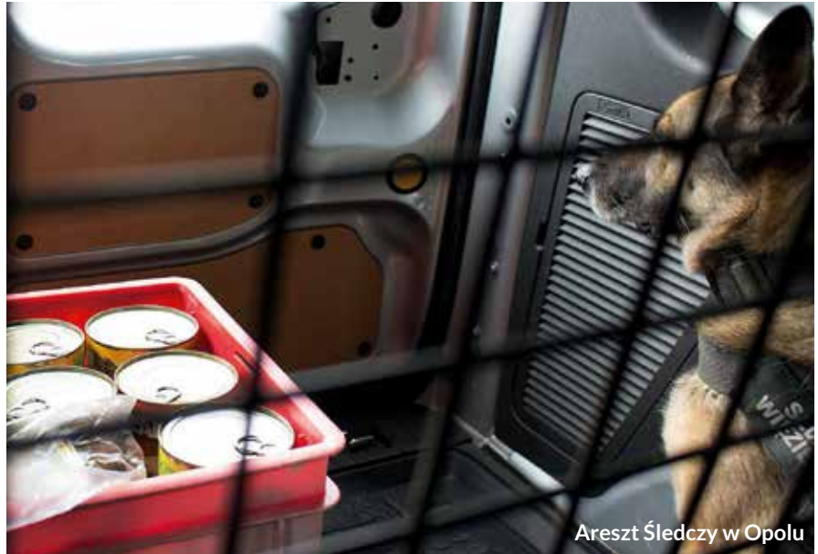
Areszt Śledczy w Opolu

Sytuacja schronisk, fundacji i stowarzyszeń zajmujących się niesieniem pomocy bezpiecznym zwierzętom stała się za sprawą pandemii jeszcze bardziej skomplikowana. Działalność wolontariuszy jest utrudniona, darczyńców ubyło, a przed zwierzętami zima do przetrwania. Na szczęście pomaganie psom i kotom przebywającym w schroniskach na dobre wpisało się w kalendarz funkcjonowania wielu jednostek penitencjarnych w całym kraju.