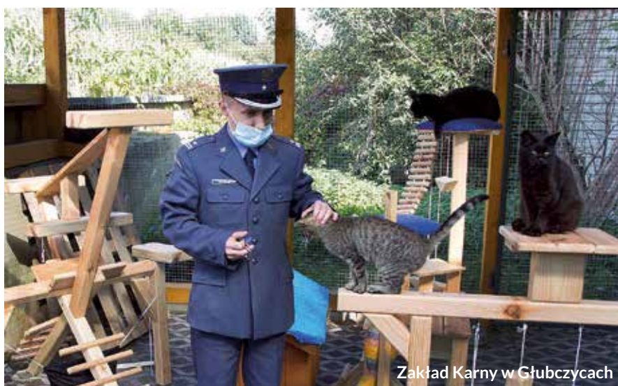
Zakład Karny w Głubczycach