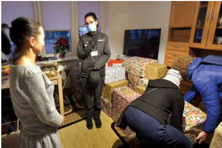
Areszt Śledczy w Warszawie-Służewcu

zmieściły się do dwóch aut. Gdy wnosili te paczki do mieszkania, mama i chłopcy nie mogli uwierzyć, że to dzieje się naprawdę.