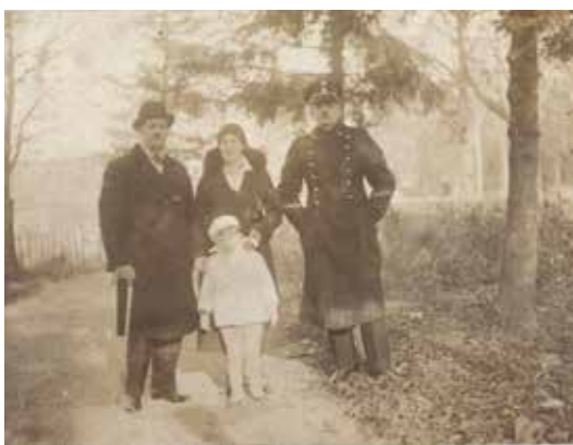
Wyższy funkcjonariusz SW w stopniu podkomisarza w otoczeniu rodzinnym (umundurowanie wz. 1932). Naczelnik katowickiego więzienia z rodziną