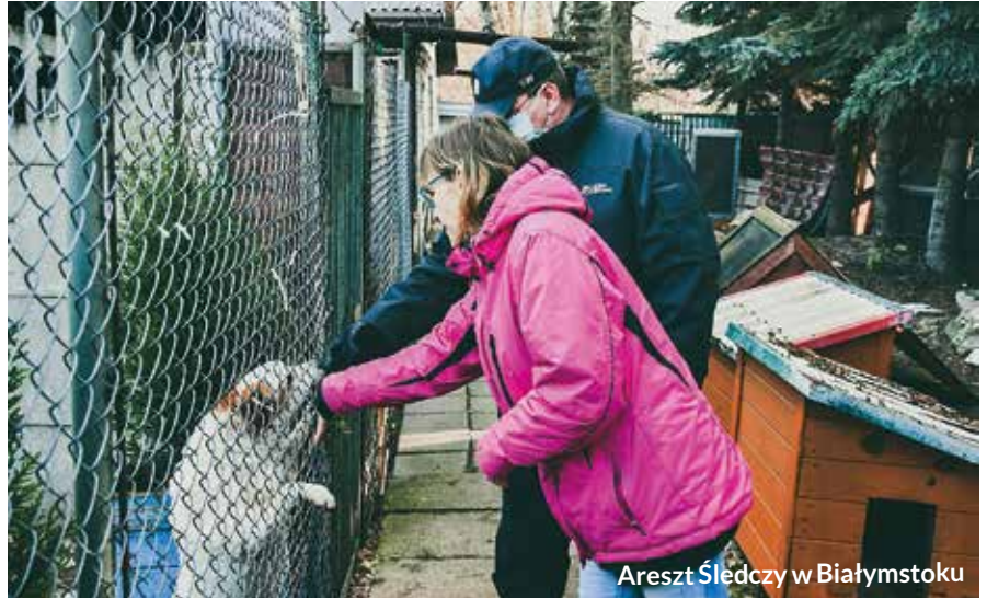
Areszt Śledczy w Białymstoku