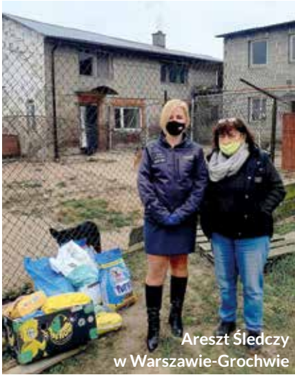
Areszt Śledczy w Warszawie-Grochowie