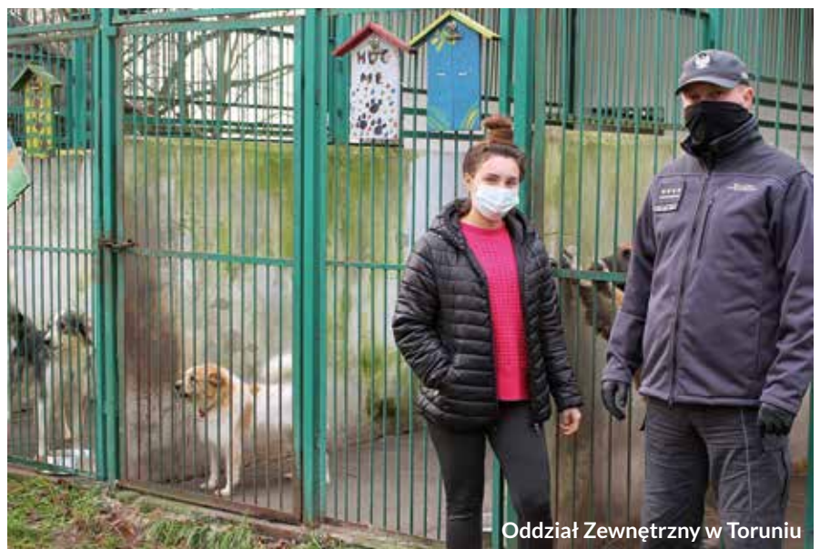
Oddział Zewnętrzny w Toruniu