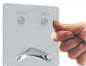
KASETA CELA II APS