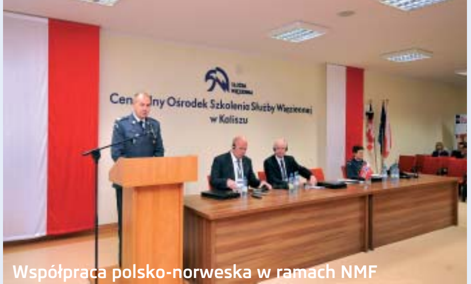
Współpraca polsko-norweska w ramach NMF