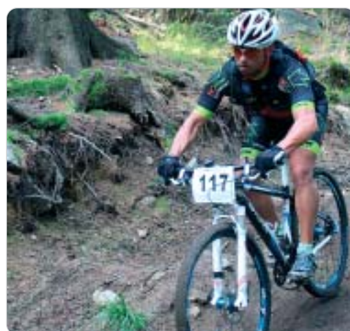
s.24 Pilnuje i rządzi