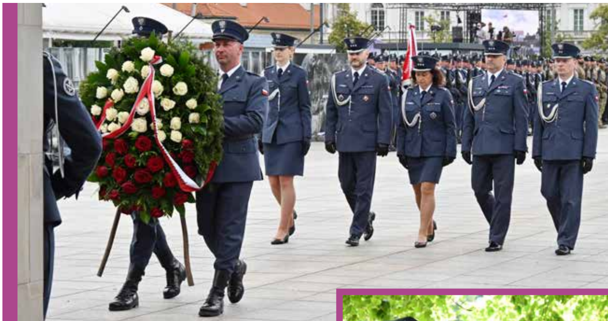
Pani prymus podczas składania wieńca na Grobie Nieznanego Żołnierza wraz z kierownictwem Służby Więziennej

tego sama, daje mi szerszy kontekst i perspektywę. W medycynie pracy poza kontaktem indywidualnym mam też możliwość prowadzenia warsztatów i szkoleń psychologicznych, co robię razem z koleżanką.