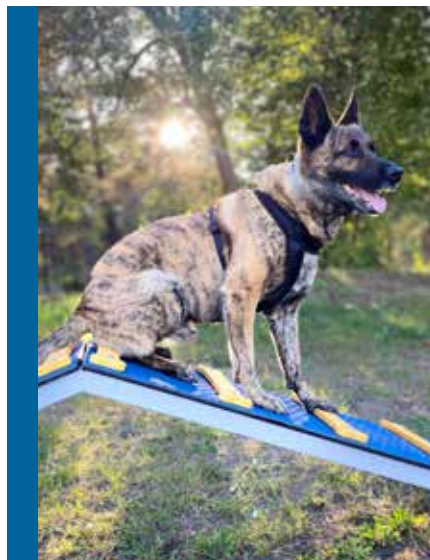
Bono to pies-hybryda - wyszkolony do gryzienia i do szukania