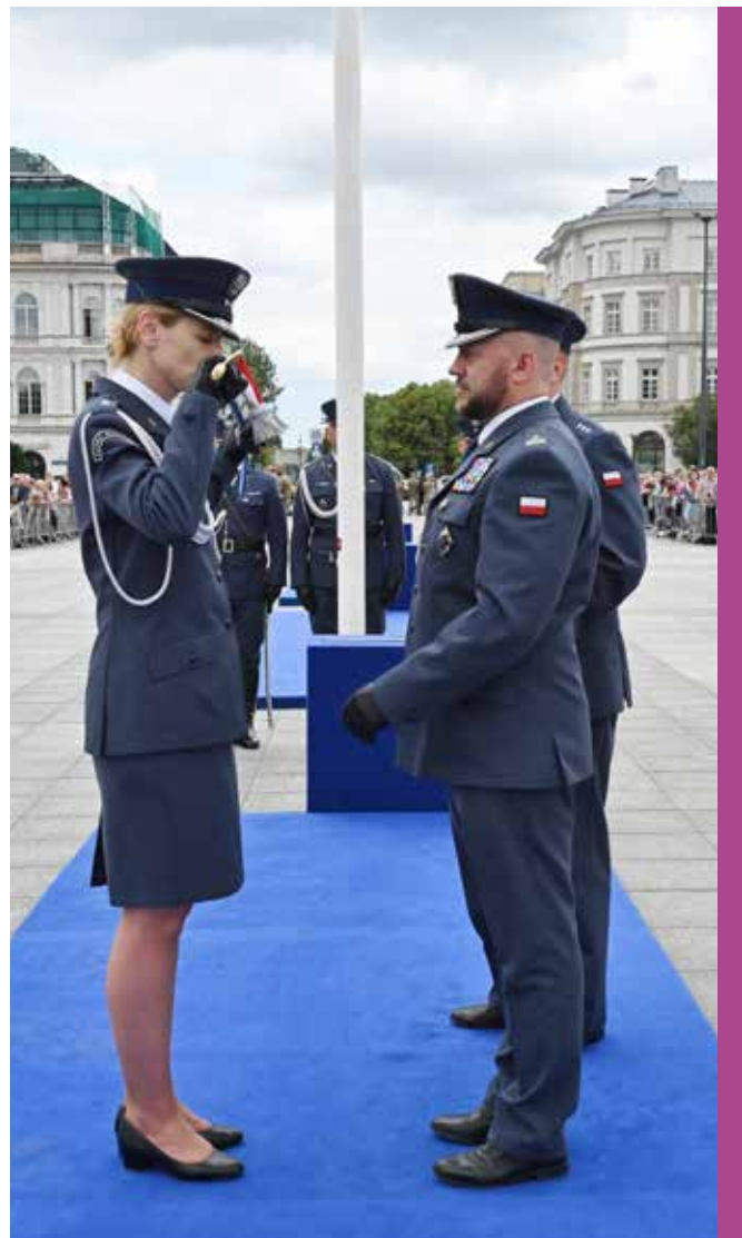
Najlepszy spośród nowych oficerów tradycyjnie dostaje szablę od Stowarzyszenia Oficerów Więziennictwa

Wymusiła to logistyka. Służbę pełniłam we Wronkach, a mieszkamy w centrum Poznania. Przy dwójce małych dzieci