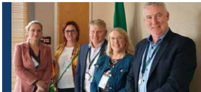
Spotkanie w siedzibie Fiosrú, Office of the Police Ombudsman w Dublinie

Zasady Méndeza najczęściej, podobnie jak RODO, spotykają się z niezrozumieniem. Kilka lat temu w korespondencji pomiędzy byłym już komendantem głównym policji a ówczesnym rzecznikiem praw obywatelskich można znaleźć informację, że po analizie zapisów ustaw, rozporządzeń i aktów wewnętrznych Komenda Główna Policji doszła do wniosku, że mamy już wszystko to, co jest w zasadach i nic nie trzeba zmieniać. Co oczywiście jest wierutną bzdurą. Bo Zasady Méndeza zostały stworzone, żeby chronić, ale przez wypaczenia, wyśmiewanie i bagatelizowanie są przedstawiane jako główny hamulcowy pracy śledczych. Tak, jak zasady ochrony danych, które mają zabezpieczać