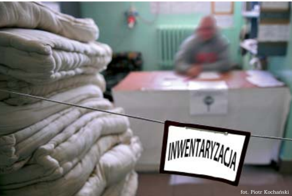
fol. Piotr Kochański

Paskudny nastrój. Mój stan ducha dobija jeszcze świadomość, że za kilka dni będę musiał uczestniczyć w... inwentaryzacji.