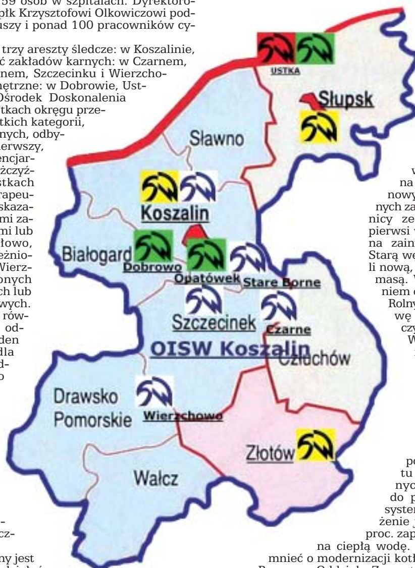
fol. Piotr Kochański

Trójstyk – punkt styku granic trzech równorzędnych jednostek terytorialnych