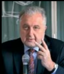
prof. dr hab. Andrzej Rzepliński

O sędziach penitencjarnych słyhać w mediach tylko wtedy, kiedy przebywając na warunkowym przedterminowym zwolnieniu skazany popełnia kolejne przestępstwo. Daje to fałszywy obraz ich pracy.