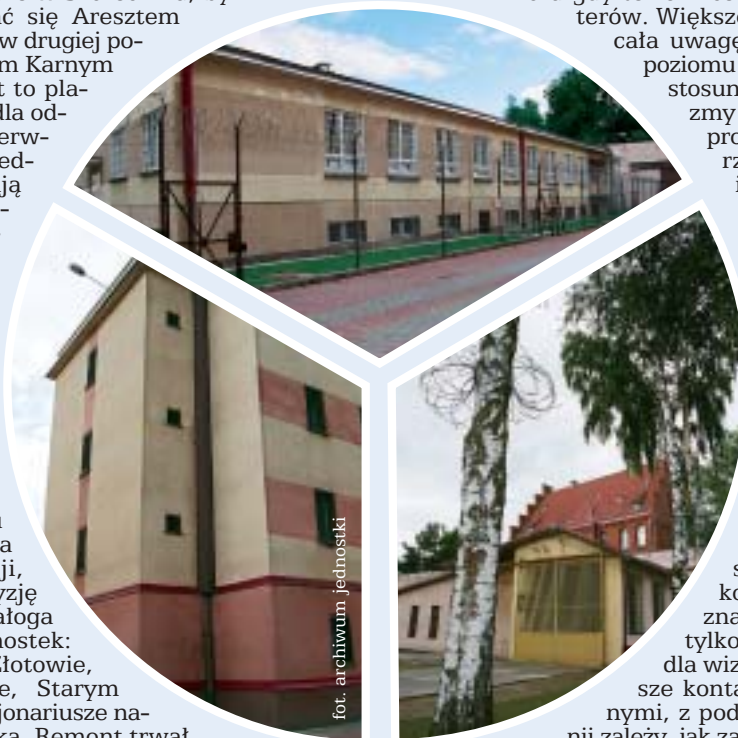
fol. archiwum jednostki