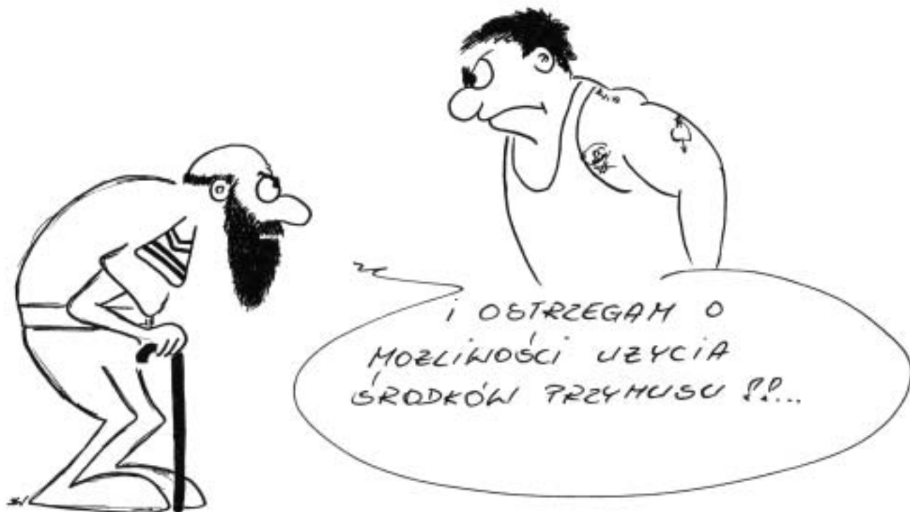
rys. Dariusz Waśko