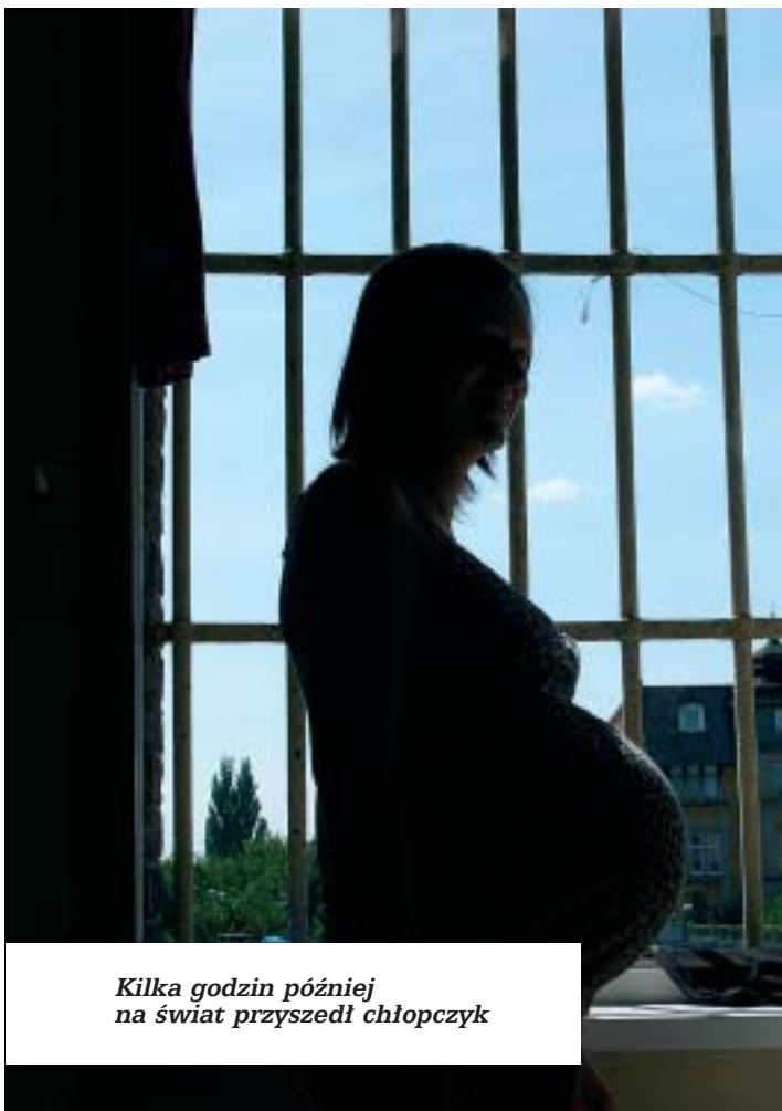
Kilka godzin później na świat przyszedł chłopczyk

Zakład Karny nr 1 w Grudziądzu jest jednym z dwóch w Polsce, gdzie skazane, tymczasowo aresztowane lub ukarane kobiety mogą przebywać razem ze swoimi dziećmi. To także jedyne więzienie, w którym maluchy przychodzą na świat. Niejednokrotnie odmieniają życie swoich matek, często dopiero tu uczących się, na czym polega macierzyństwo.