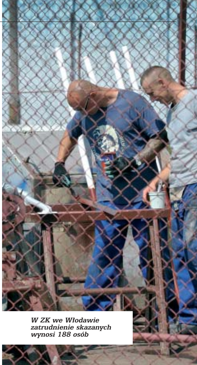
W ZK we Włodawie zatrudnienie skazanych wynosi 188 osób

Spacerujemy po obiekcie. Większość budynków jest odnowiona, część nie. Jedni mają lepsze warunki odbywania kary, inni gorsze. Idziemy do jednego z wyremontowanych budynków. Od-