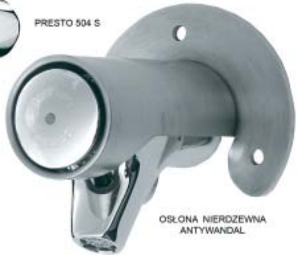
OSŁONA NIERDZEWNA ANTYWANDAL