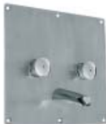
PRESTO KASETA CELA