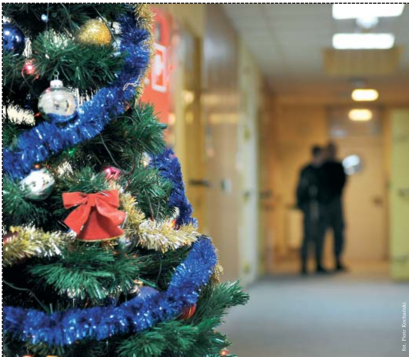
fol. Piotr Kochański