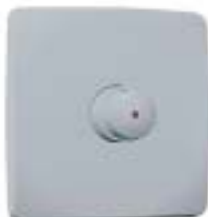
PRESTO 500 BS