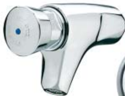
PRESTO 504 S