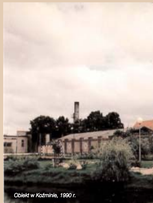
Obiekt w Koźminie, 1990 r.

Pion cywilny miejscowego Inspektora AK w ograniczonym zakresie mógł im pomagać. Możliwe było to tylko wobec zatrudnionych na zewnątrz, którym potajemnie przekazywano chleb. Koor-