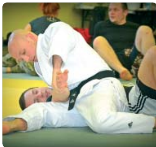
s.28 Mistrz Polski w klasie garłaczy