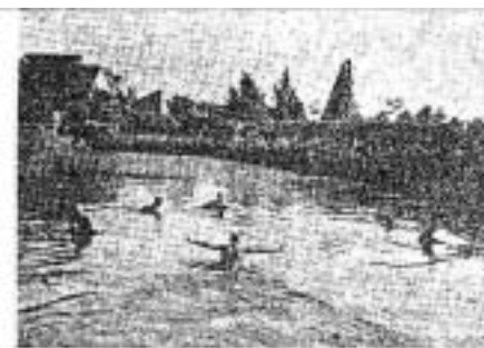
Kąpiel w stawie zakładowym.