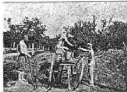
Praca w ogrodzie.