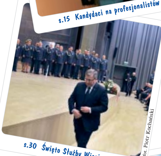
s.30 Święto Służby Więziennej