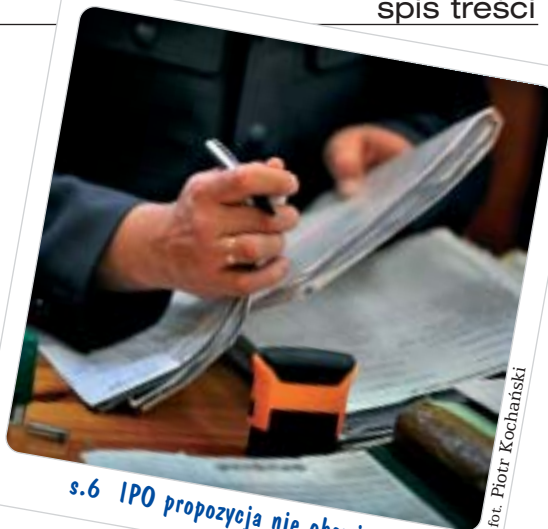
s.6 IPO propozycja nie obowiązek