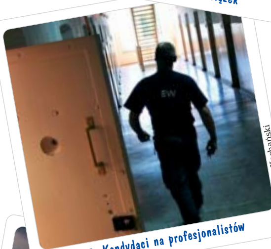
s.15 Kandydaci na profesjonalistów