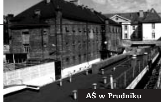
AŚ w Prudniku