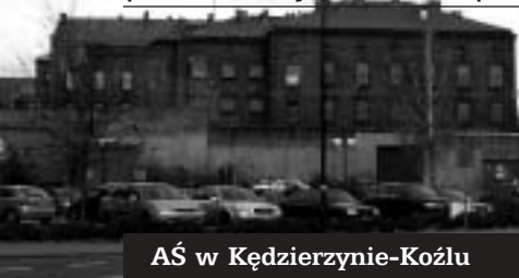
AŚ w Kędzierzynie-Koźlu