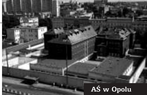
AŚ w Opolu