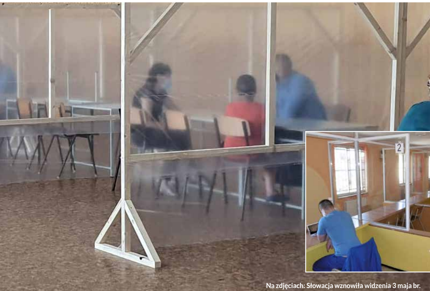
Na zdjęciach: Słowacja wznowiła widzenia 3 maja br.

karnego odwiedzający muszą przedstawić krajowy certyfikat powiązany z systemem e-Zdrowie. Podczas wizyty w więzieniu należy zachować dwumetrowy dystans, nosić maskę i unikać bezpośredniego kontaktu. Zezwala się na odwiedziny nie więcej niż dwóch osób. Od trzeciego maja osadzeni odbywający karę w koloniach karnych typu otwartego i półotwartego mają prawo do krótkoterminowych przepustek oraz do poruszania się bez eskorty poza terenem zakładu karnego.