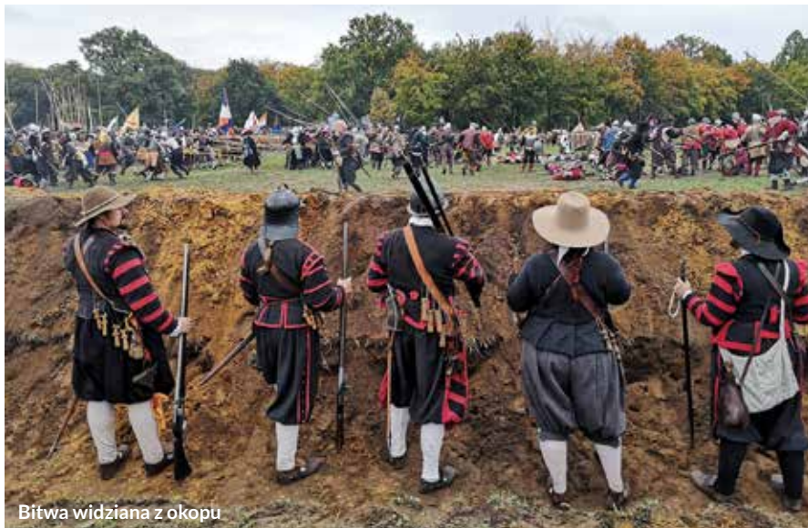
Bitwa widziana z okopu

Ponieważ, jak mówi rekonstruktor, historia wymaga od nich, żeby wozili sprzęt adekwatny historycznie, nie używają składanych rurek ani plastikowych płacht. Wszystko jest z oryginalnych materiałów, z bawełny, lnu, drewna. Poza tym oprócz namiotów mieszkalnych rozstawiają wiaty, żeby w ciągu dnia mieć gdzie usiąść i przygotować się do bitwy. Sprzętu jest więc dużo. Do tego trzeba było wziąć ciepłe koce, siennik do wypchania słomą