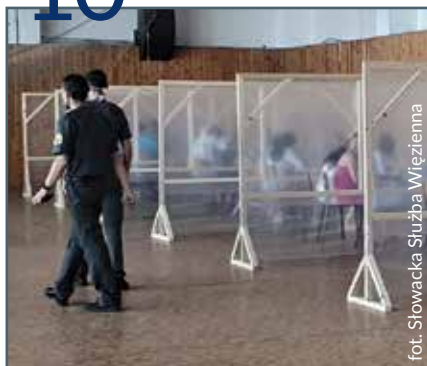
Odmrażanie widzeń. Jak to robią w innych krajach