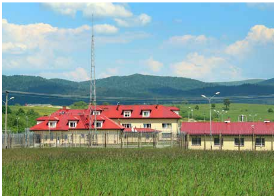
Zakład Karny w Łupkowie

12 Odpoczywam, kiedy... starszy syn powiedział kiedyś, że nie potrafię odpoczywać... Coś w tym chyba jest, bo lubię, gdy coś się dzieje. Lubię ruch i aktywność, a bierność i nuda mnie męczą.