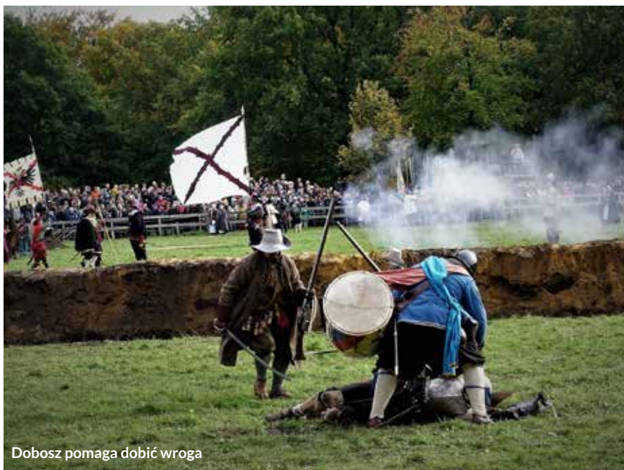
Dobosz pomaga dobić wroga

albo sianem, naczynia drewniane lub gliniane, pasujące do epoki sztucce (mogą być drewniane lub posrebrzane), kufel.