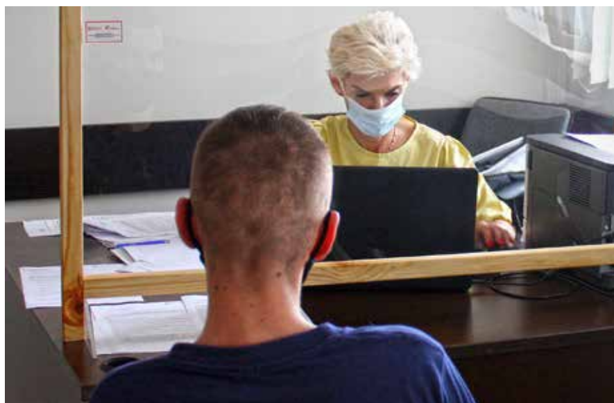
W pokoju mediatora w Areszcie Śledczym w Lublinie

już wykorzystany. – Lista skazanych oczekujących na spotkanie z mediatorem np. w Areszcie Śledczym w Lublinie stale się powiększa – mówi major Turowska. – W każdej jednostce penitencjarnej przygotowano pokój mediatora. Zgodnie z założeniami projektu każdy został wyposażony w meble (stół, krzesła, szafę metalową) i sprzęt: laptop, drukarkę. Służba Więzienna zapewniła dostęp do internetu – odrębne łącze przeznaczone tylko do pracy mediatora.