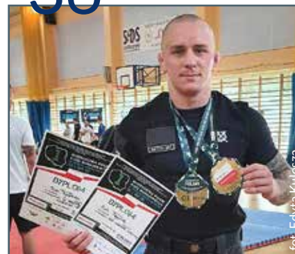
Od zapasów po morsowanie