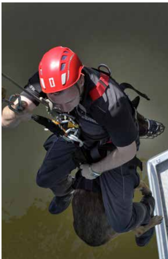
Ćwiczenia w Uhowie nad Narwią

Wydanie, które na lipiec proponujemy czytelnikom, w dużej części traktuje o tym, jak Służba Więzienna jest przygotowana do realizowania swoich zadań i misji.