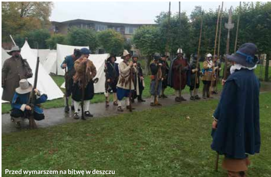
Przed wymarszem na bitwę w deszczu