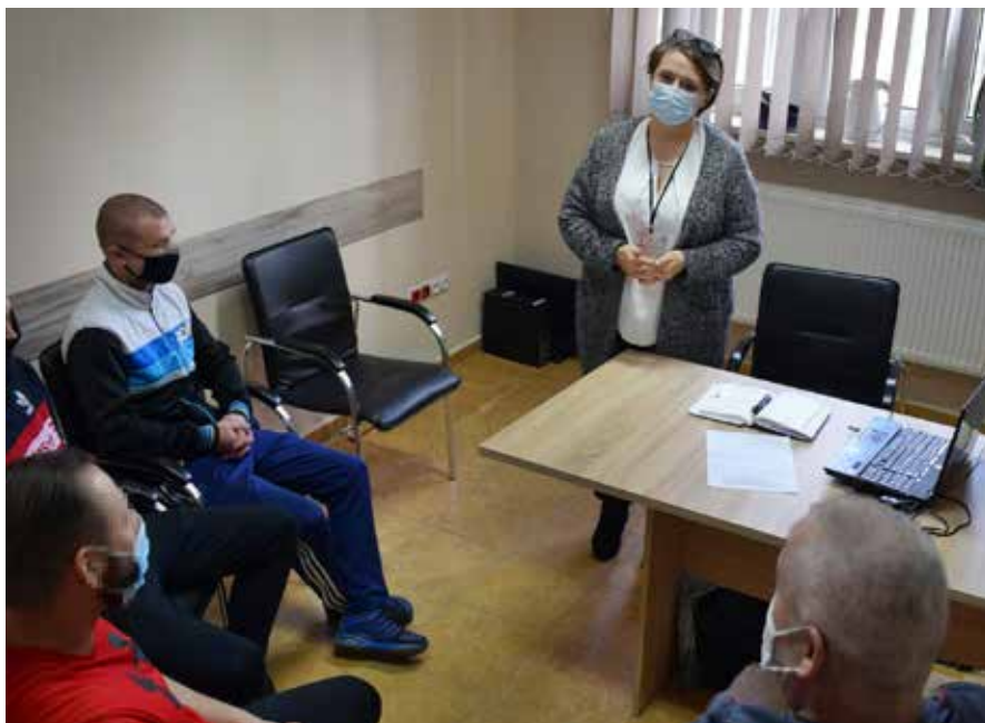
Spotkanie informacyjne w Zakładzie Karnym we Włodawie