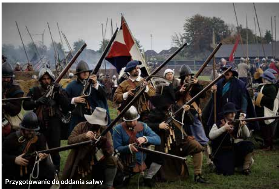
Przygotowanie do oddania salwy