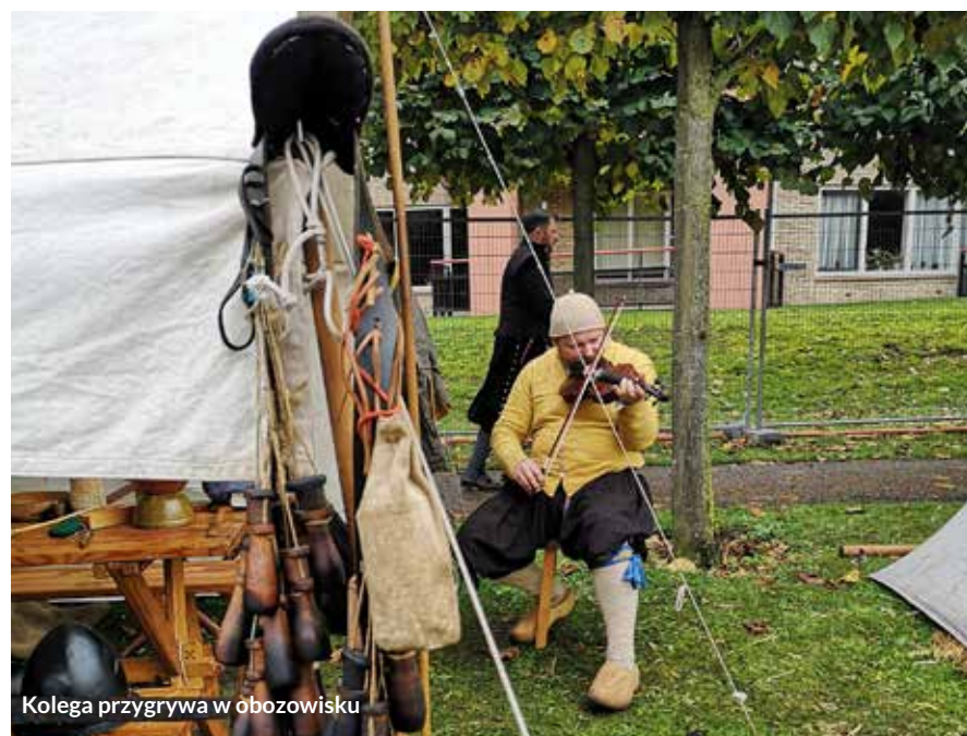
Kolega przygrywa w obozowisku