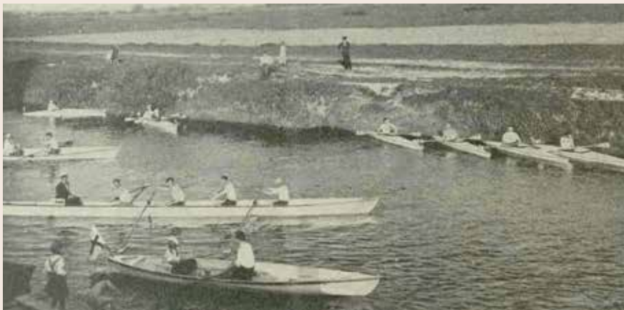
Otwarcie sezonu w Klubie Wioślarskim „Temida” w Łucku. Łodzie i kajaki klubu na wodzie. „Przegląd Więziennictwa Polskiego” nr 6 z 1932 r.

odnajmować pracownikom więziennym oraz ich rodzinom na czas urlopu pojedyncze lub wspólne pokoje.