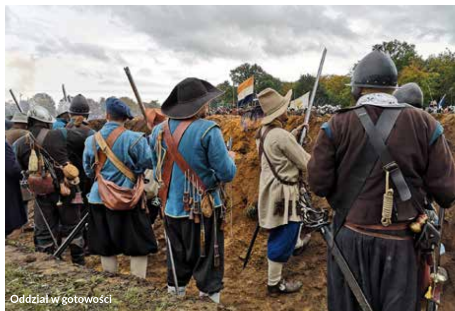
Oddział w gotowości