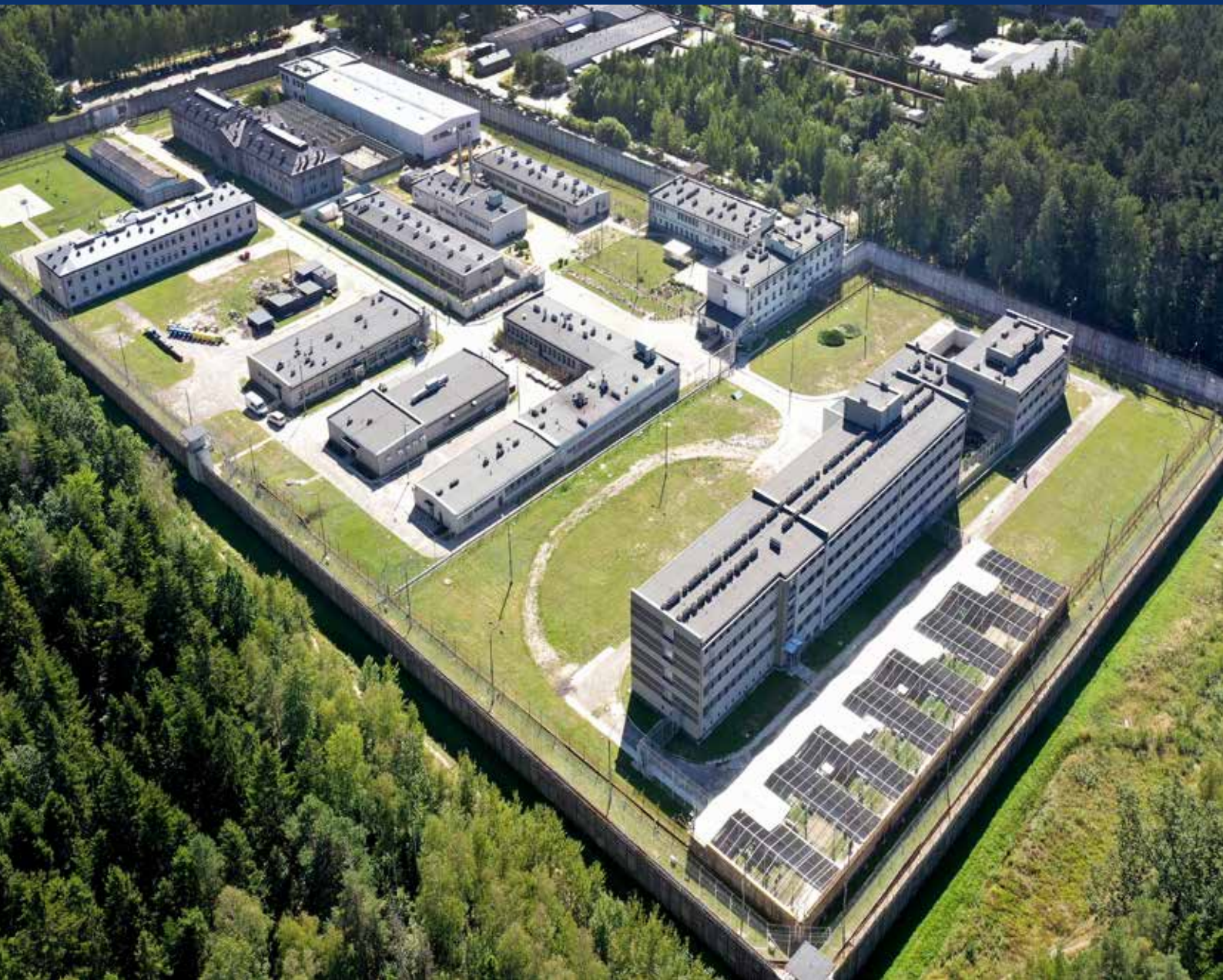
Więżenie z lotu drona – Areszt Śledczy w Kielcach