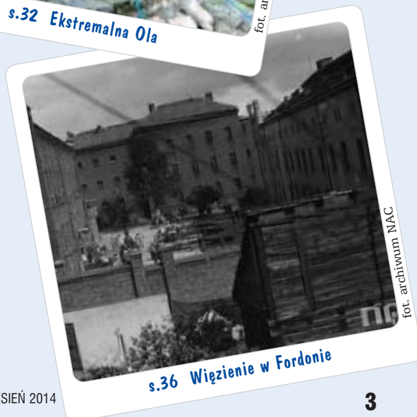
s.36 Więzienie w Fordonie