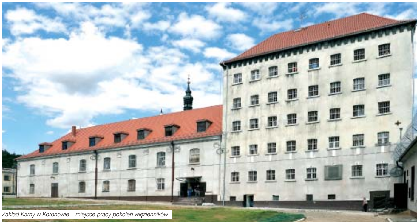
Zakład Karny w Koronowie – miejsce pracy pokoleń więźniaków