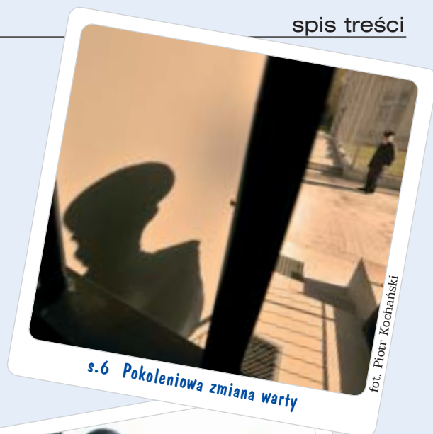
s.6 Pokoleniowa zmiana warty