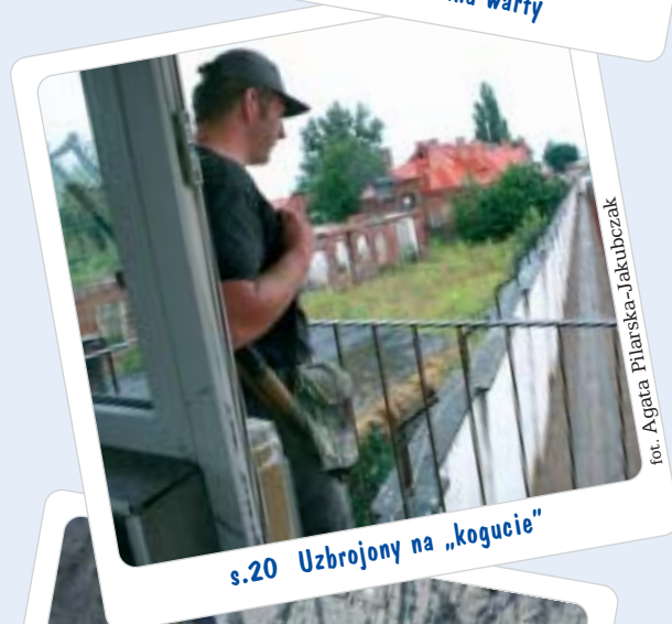
s.20 Uzbrojony na „kogucie”