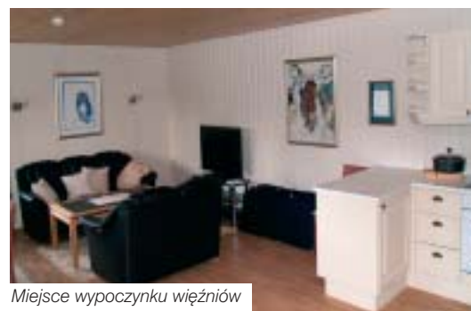
Miejsce wypoczynku więźniów