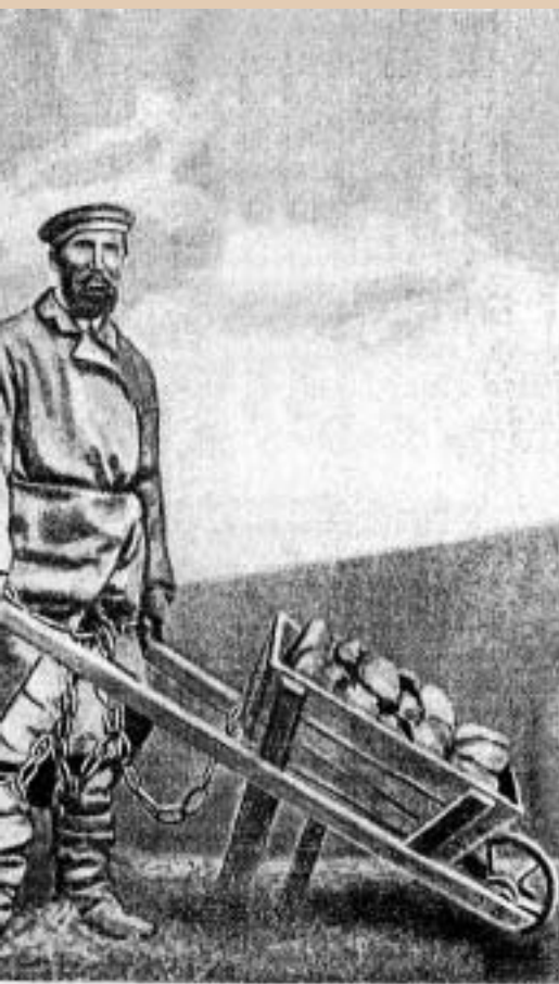
Каторжник, прикованный к тачке. (Приковывание к тачке было отменено в 1903 году.)

rejonach imperium. Orzekano ją na czas nieokreślony (dożywotnio) lub terminowy. W tym ostatnim przypadku kategorię można było połączyć z dożywotnim osiedleniem na Syberii albo, w formie łagodniejszej, terminowym zesłaniem. Na ziemiach byłego Królestwa Polskiego nasilenie orzekania kary kategorii nastąpiło w okresie po rewolucji 1905 r. Tylko w Warszawskim Wojskowym Okręgu Sądowym w latach 1905-1908 skazano 574 osoby, przede wszystkim z powodów politycznych. W 1912 r. w całym imperium na tę karę skazano 547 więźniów politycznych i kryminalnych. Okres kategorii liczono od dnia ogłoszenia wyroku, bez uwzględnienia wielu lat pozostawania w śledztwie. Po uprawomocnieniu, skazanego ubierano w szary chałat (ubiór) katorżniczy, a nogi zakuwano w 12-funtowe kajdany z łańcuchem połączonym z szerokim pasem na biodrach. Katorżnik miał prawo do posiadania chusteczki, torby i kociołka będących w opiniach więźniów godłem przyszłego „bradiagi”. Skazany był co dwa tygodnie przymusowo golony, co Feliks Kon (w 1889 r. skazany na karę 8 lat katorgi) za każdym razem boleśnie odczuwał i był głęboko oburzony, gdyż „było to naigrywanie się nad moją ludzką godnością”.