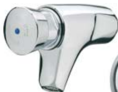
PRESTO 504 S