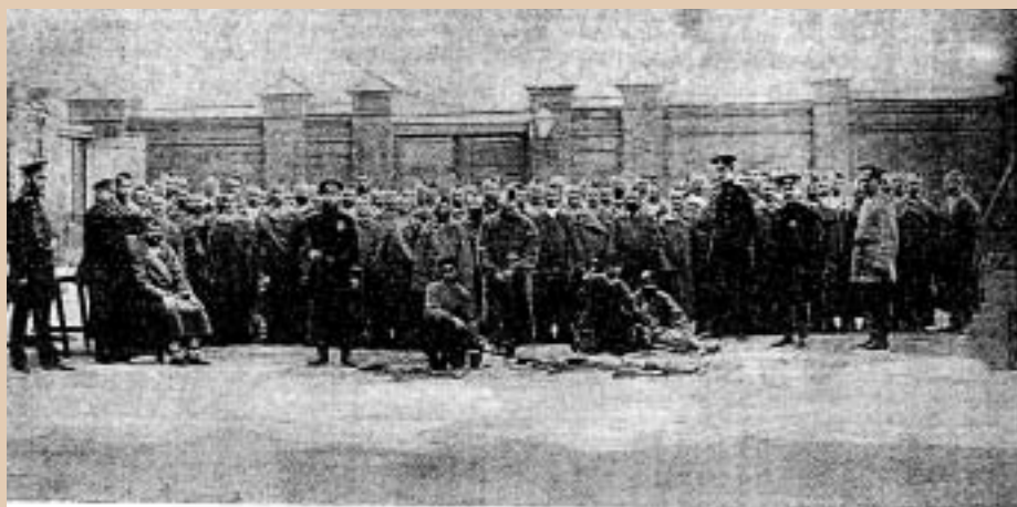
Бритые головы и заколки в кандалах в Московской Бутырской тюрьме.

Zdzisław Szenk zmarł 4 stycznia 1919 r. Stanisław Choiński od tegoż roku pełnił obowiązki naczelnika, a od 1 lutego 1919 r. rozpoczął służbę w innych, kolejno wyższych strukturach. Służbę zakończył 17 września 1939 r. pod Łuckiem. Za działalność na rzecz niepodległości Stanisław Choiński został uhonorowany Srebrnym Krzyżem Zasłu-