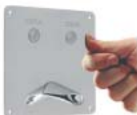
KASETA CELA II APS