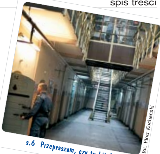
s.6 Przepraszam, czy tu biją?