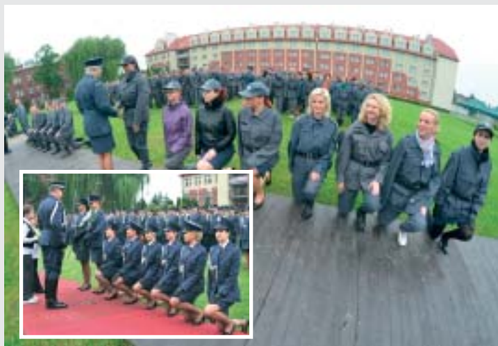
zdjęcia Jakub Sadurski, Grzegorz Wieczorek COSSW w Kaliszu Piotr Kochański