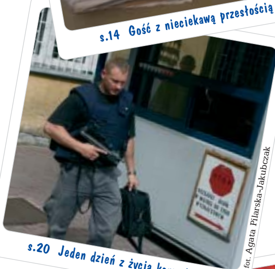
s.20 Jeden dzień z życia konwojenta