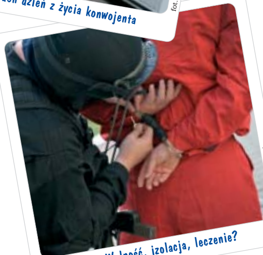
s.29 Wolność, izolacja, leczenie?