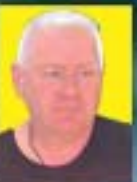
Milan Tukan System, Modern Combat