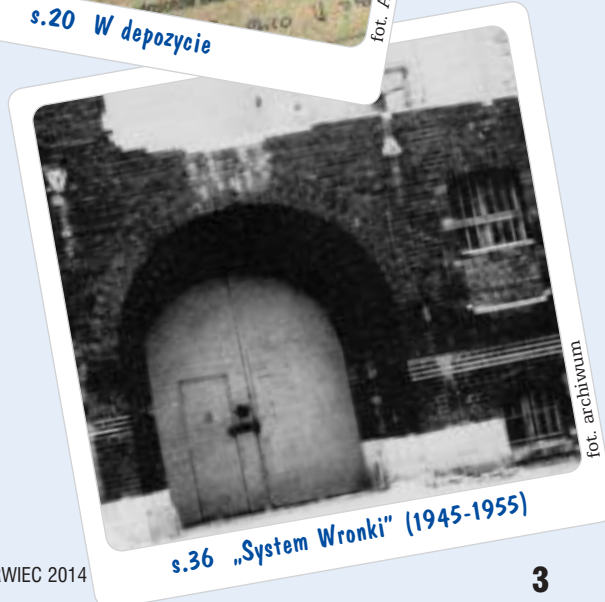
s.36 „System Wronki” (1945-1955)