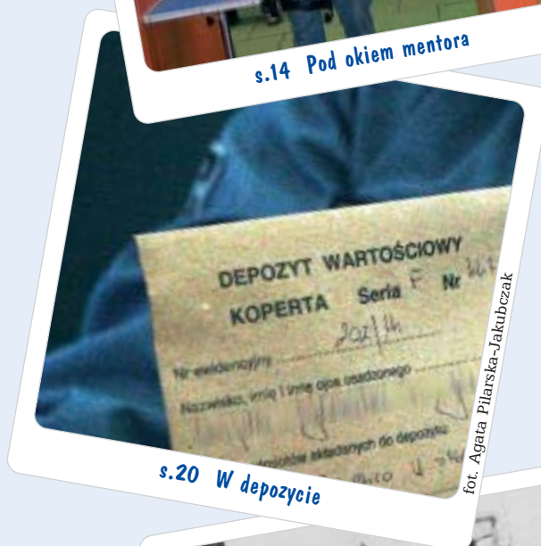
s.20 W depozycie