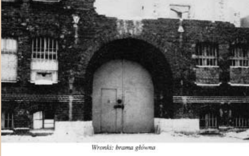
Wronki: brama główna

ścia nie ma – nikt nie wychodzi, tylko wywożą go aleją lipową”.