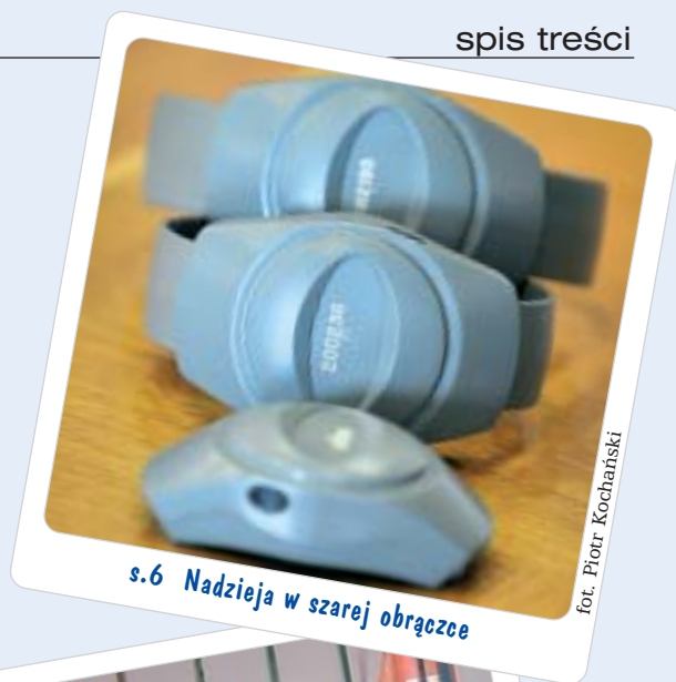
s.6 Nadzieja w szarej obrączce