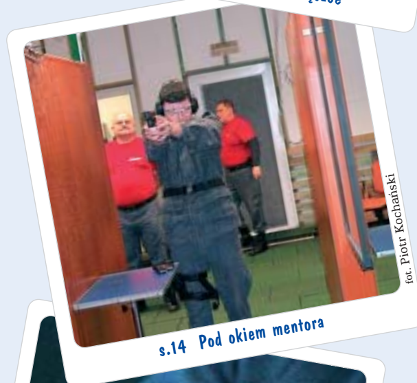
s.14 Pod okiem mentora