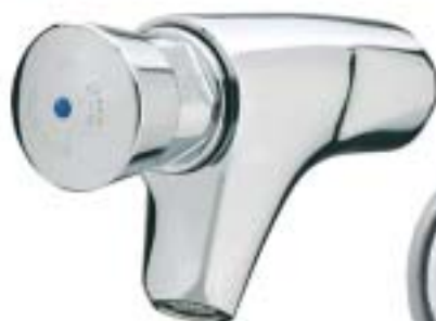
PRESTO 504 S