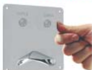
KASETA CELA II APS