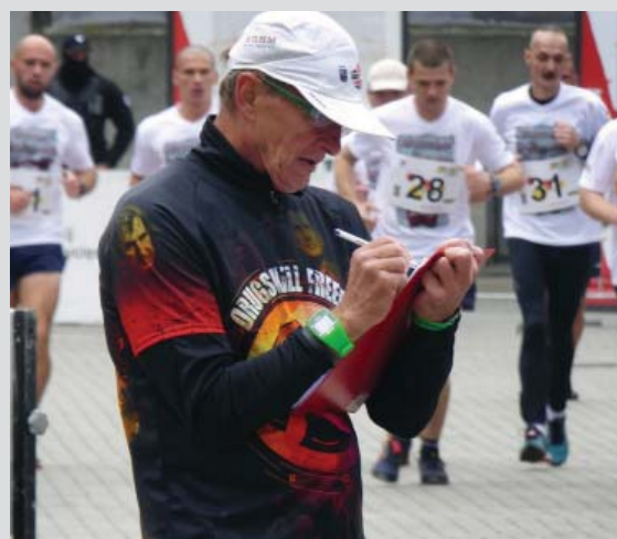
s. 22 Złota Setka