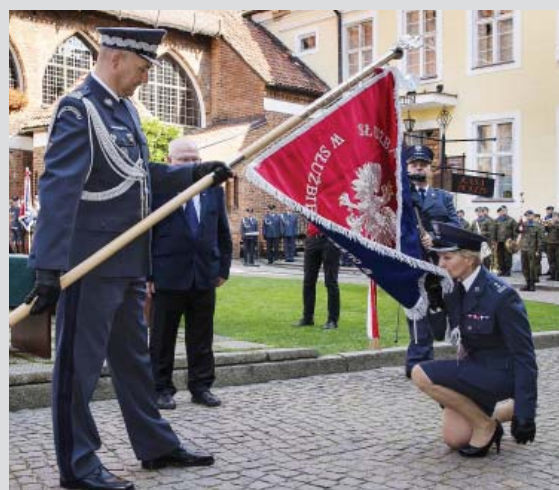
s. 11 Nowe sztandary