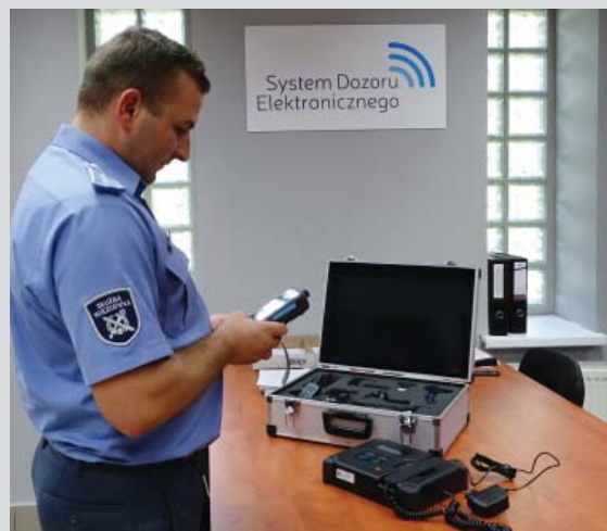
s. 8 System Dozoru Elektronicznego