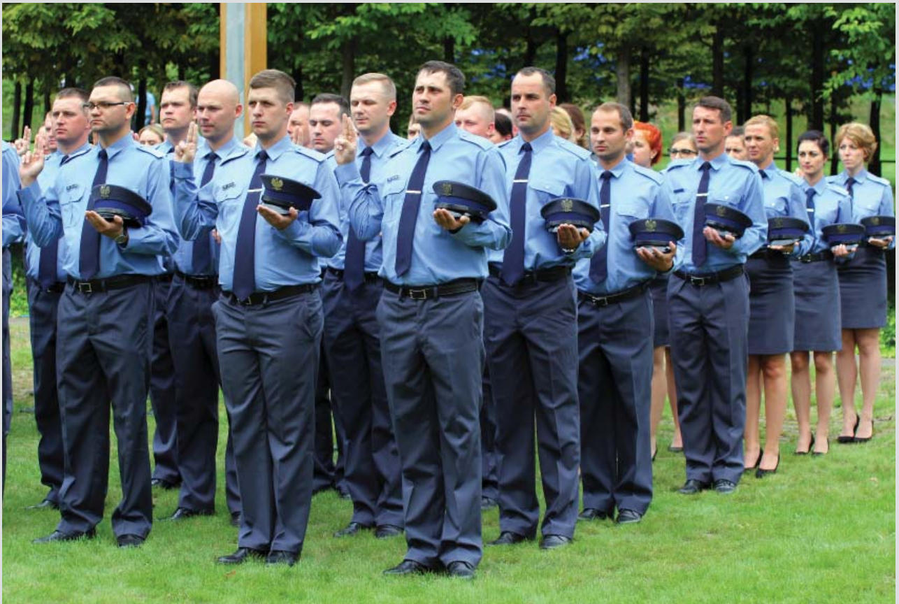
11 września 2018 r., uroczyste ślubowanie funkcjonariuszy Służby Więziennej w Muzeum Katyńskim

Każdy spośród 29 tysięcy funkcjonariuszy Służby Więziennej ślubował to samo: zadania wykonywać rzetelnie, przestrzegać konstytucji i wszystkich przepisów prawa oraz etyki, strzec tajemnic, szanować godność ludzką i dbać o dobre imię służby. Świadcami tej doniosłej chwili zawsze są przełożeni, często rodziny, czasem osoby znamienite. 84 funkcjonariuszom, którzy ślubowali 11 września, towarzyszyła także historia w jej najlepszym, choć smutnym wydaniu: relikwie pierwszych funkcjonariuszy Niepodległej, którzy za mundur, służbę w Straży Więziennej i za ojczyznę, zapłacili życiem.