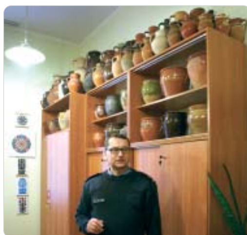
s.24 Trzygwiazdkowy zawodowiec