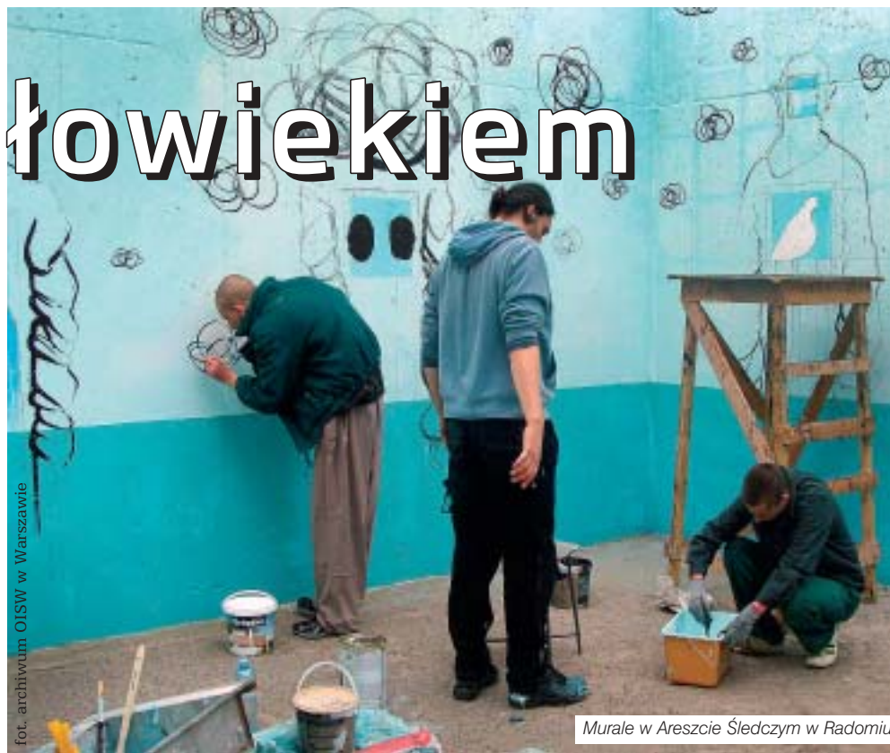
Murale w Areszcie Śledczym w Radomiu

śle zaplanowany, co regulują odgórne zasady. Porządek dnia określający godziny wydawania posiłków, spacerów czy kąpiele ze względów organizacyjnych i bezpieczeństwa jest jednakowy dla wszystkich, chociaż i tu zdarzają się odstępstwa, np. dla skazanych uczących się czy pracujących. Programy wolnościowe wprowadzane w jednostkach penitencjarnych umożliwiają osadzonym opuszczenie więzienia, nawiązania kontaktu ze światem zewnętrznym, ograniczają zjawisko przonizacji, dają poczucie większej swobody funkcjonowania i w pewnym zakresie decydowania o sobie.