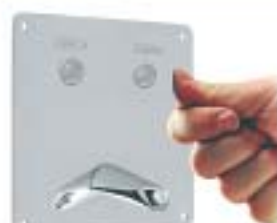
KASETA CELA II APS