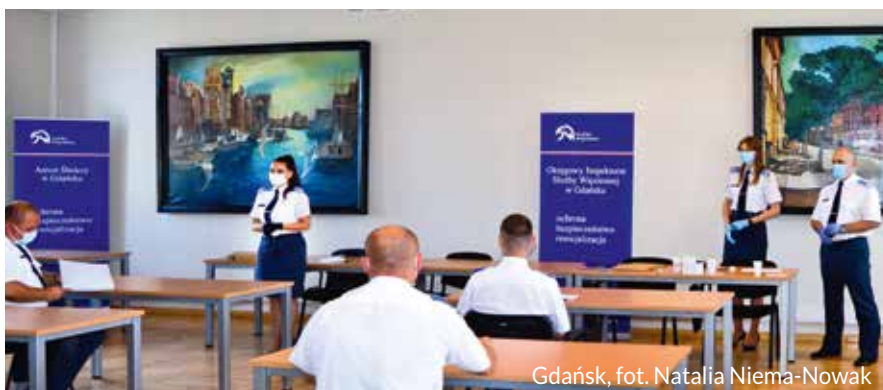
Gdańsk, fot. Natalia Niema-Nowak