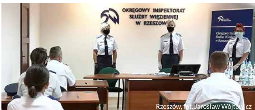
Rzeszów, fot. Jarosław Wójtowicz