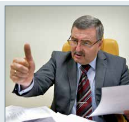
gen. Paweł Nasiłowski

– Każda czynność, którą należy przeprowadzić w miejscu zamieszkania skazanego, wymaga realizacji trójstopniowego rozpoznania, głównie w formie wywiadu epidemicznego. Po raz pierwszy podczas ustalania terminu czynności, drugi: w momencie potwierdzania terminu i trzeci: raz w dniu wizyty, na godzinę przed wejściem. To wszystko realizuje centrala monitorowania w Warszawie. Zespoły terenowe