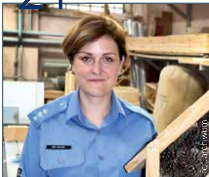
Siano dla słonia i inne pomysły