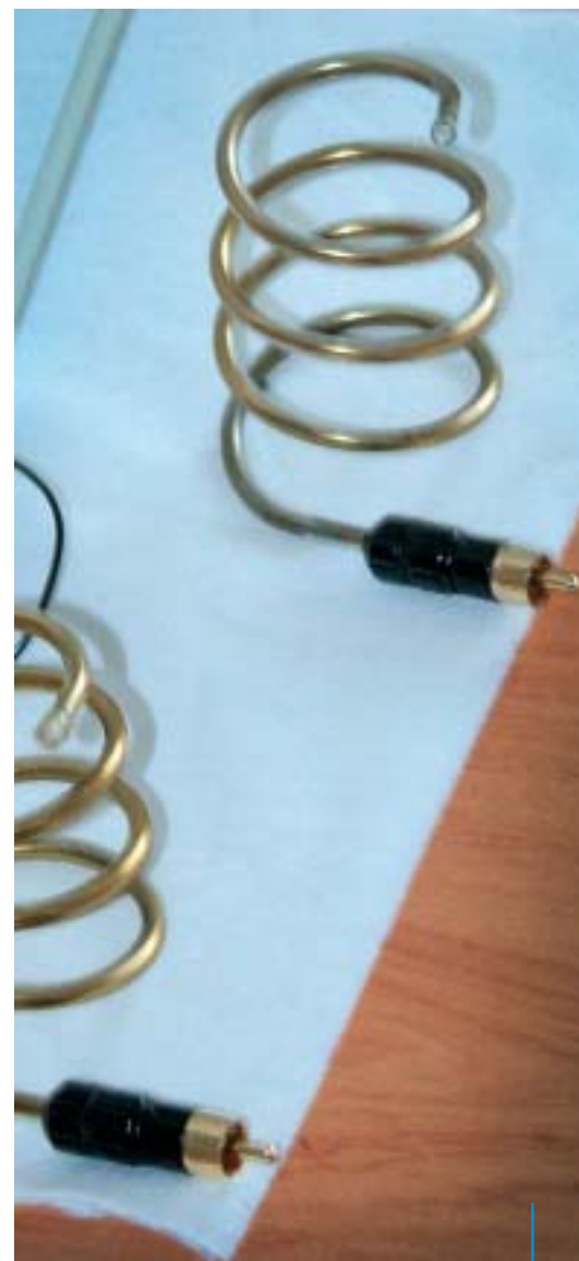
Tym urządzeniem bada się poziom ukrwienia narządów płciowych w zależności od stymulacji bodźcami wizualnymi

– Statystyki są dokładnie prowadzone. Od września 1998 r. do końca 2011 r. w oddziale przebywało 315 skazanych, z tego 254 zakończyło już odbywanie kary.