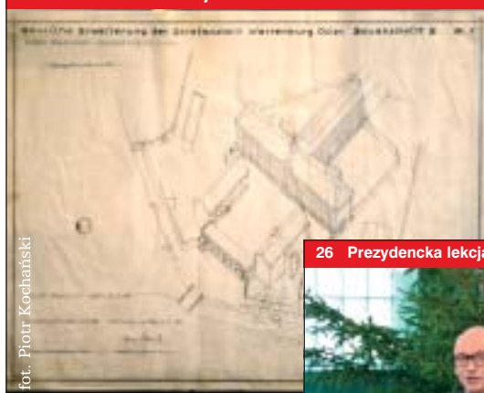
36 200 lat na Klasztornej