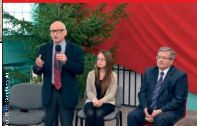
26 Prezydencka lekcja historii