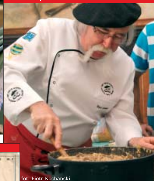
20 Przez żołądek do...