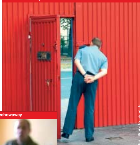
6 Warunkowe przedterminowe zwolnienie