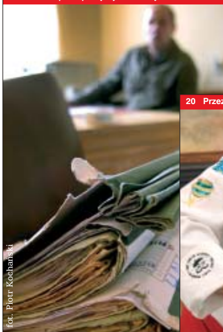
10 Z lochu pod opiekę wychowawcy