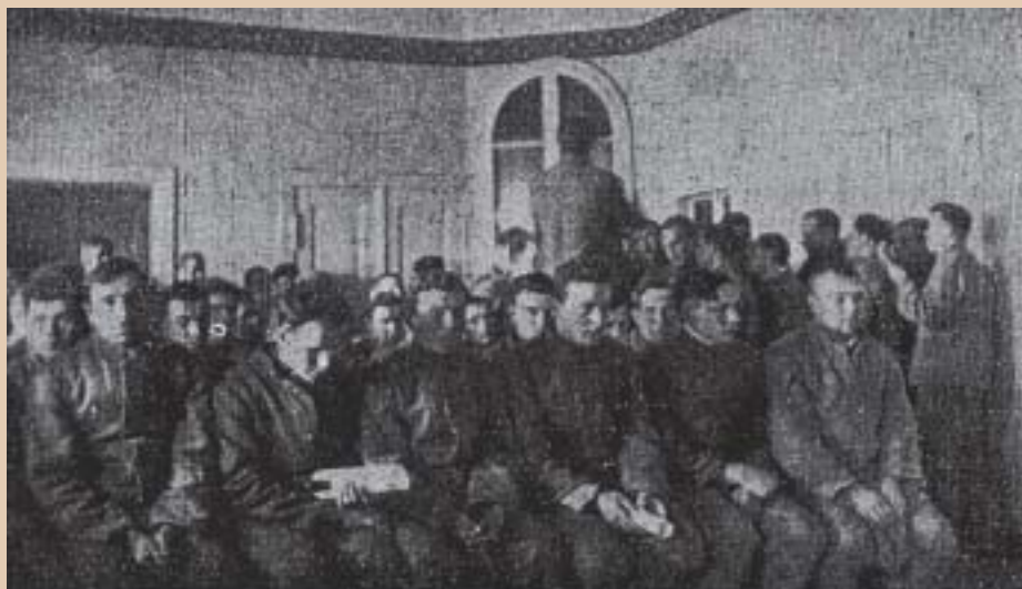
Absolwenci szkoły ogólnokształcącej w Kolonii rolniczej

Trzecim środkiem resocjalizacyjnym było oddziaływanie wychowawcze, na które składało się oddziaływanie moralne i obywatelskie realizowane przez personel i nauczycieli, oddziaływanie religijne realizowane przez kapelana oraz duchownego prawosławnego i grekokatolickiego. Ponadto więźniowie uczestniczyli w zajęciach sportowych i kulturalno-oświatowych. Działywały dwa chóry, polski i huculski, oraz orkiestra (złożona ze strażników i więźniów). Nadzór penitencjarny nad zakładem w Mrowinie sprawował prokurator Sądu Okręgowego w Poznaniu, a nadzór służbowy – naczelnik więzienia w Poznaniu. Kierownikiem gospodarstwa a następnie więzienną kolonią rolniczą był pro-