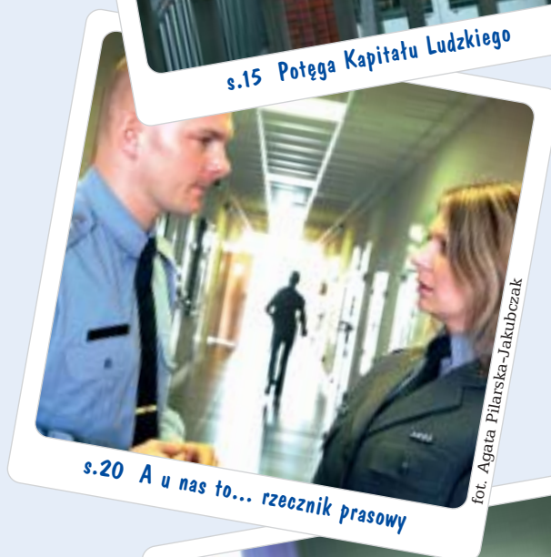
s.20 A u nas to... rzecznik prasowy