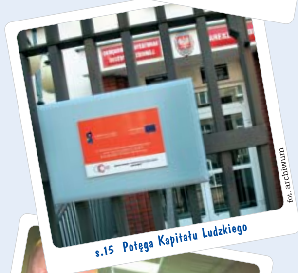
s.15 Potęga Kapitału Ludzkiego