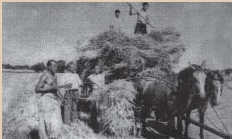
Praca więźniów w polu