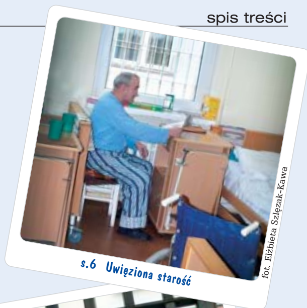
s.6 Uwięziona starość