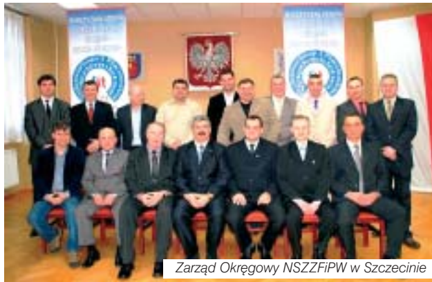
Zarząd Okręgowy NSZZFiPW w Szczecinie

lik czy Turniej Halowy Służb Mundurowych Powiatu Goleniowskiego). W okresie letnim współorganizuje spływy kajakowe. Obecna organizacja związkowa w goleniowskim zakładzie liczy 78 członków.