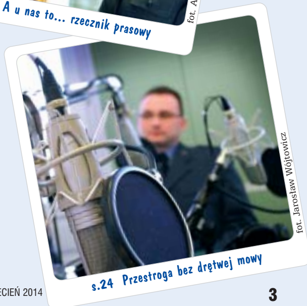
s.24 Przestroga bez drętwej mowy