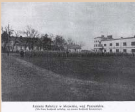
Kolonia karna w Mrowinie, woj. Poznańskie. (Na pierwszym planie widoczny jest teren kolonii karnych.)

W 1933 r. naczelnik więzienia w Poznaniu przejął od Skarbu Państwa poparcelacyjną resztówkę w miejscowości Mrowino k. Poznania o pow. 177 ha.