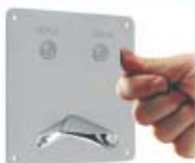
KASĘTA CELA II APS