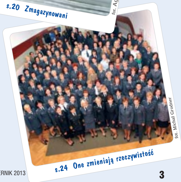
s.24 One zmieniają rzeczywistość