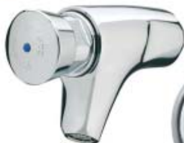
PRESTO 504 S