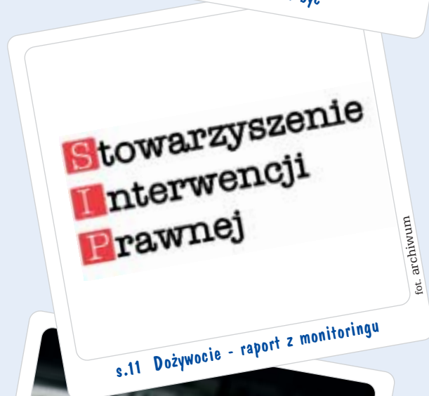
s.11 Dożywocie - raport z monitoringu