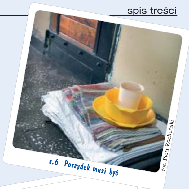
s.6 Porządek musi być